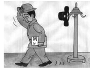
画/孟宪平《换顶“帽子”下基层》